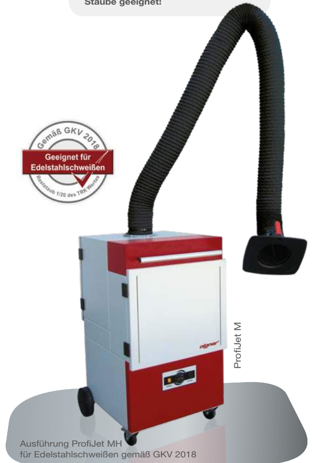
Ausführung ProfiJet MH für Edelstahlschweißen gemäß GKV 2018

Achtung: Nicht für explosionsfähige Stäube geeignet!