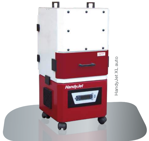
HandyJet XL auto