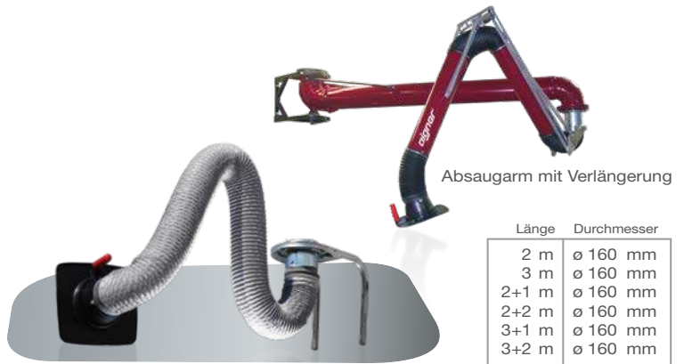
Schlaucharm (Gelenk innenliegend)

Perfekt über innenliegende (alternativ außenliegende) Pantographen (patentiert) ausbalancierter Absaugarm mit einer aerodynamisch geformten Absaughaube und gut greifbarem Griff. Mittels seiner 3 Gelenke und der drehbaren Montage an der Wandkonsole auf einer selbstschmierenden Dichtung kann der Arm optimal zur Schadstoffquelle hin ausgerichtet werden.