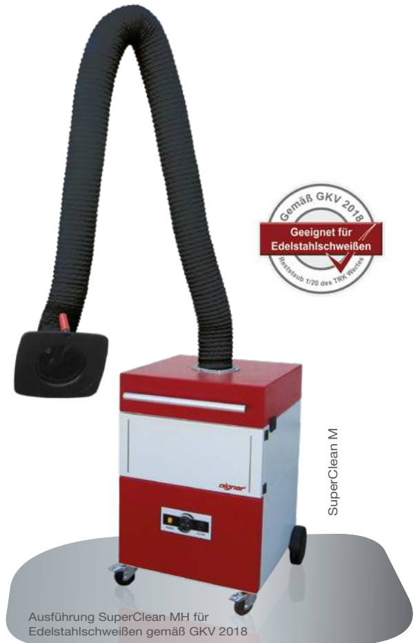
Ausführung SuperClean MH für Edelstahlschweißen gemäß GVK 2018

Achtung: Nicht für explosionsfähige Stäube geeignet!