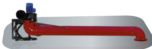
Verlängerung für Absaugarm (Lieferumfang ohne Ventilator)

Diese verlängert den Arbeitsbereich der Absaugarme auf bis zu 8 m. Aus Stahlrohr gefertigt mit engen Radien, um niedrige Bauhöhen zu ermöglichen. Der drehbare Sockel hat einen Drehflansch, der einen sauberen Anschluß der Rohrleitung ermöglicht.